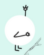
NAAST/ROND HET VELD