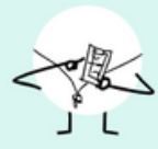
TIJDENS DE TRAINING