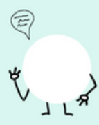
COMMUNICEREN MET OUDERS