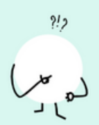
IK SCHRIJF MIJN KIND IN