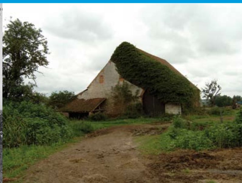
De Duivelschuur van Hoeve Groot Amelgem.