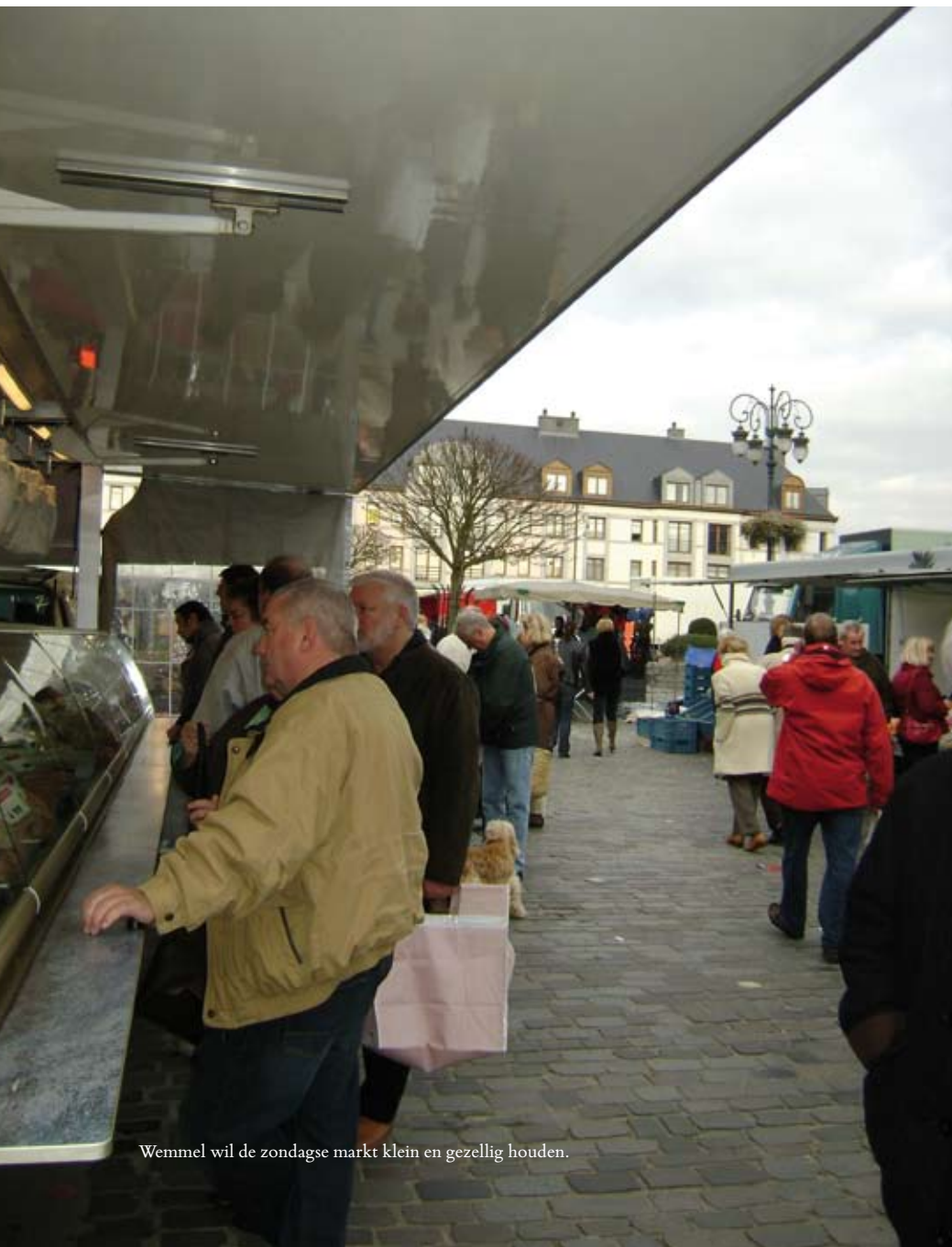
Wemmel wil de zondagsmarkt klein en gezellig houden.